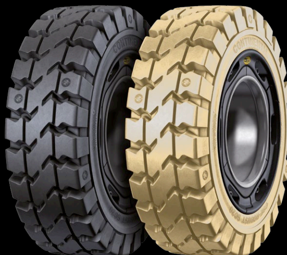
CSEasy SC20 Clean