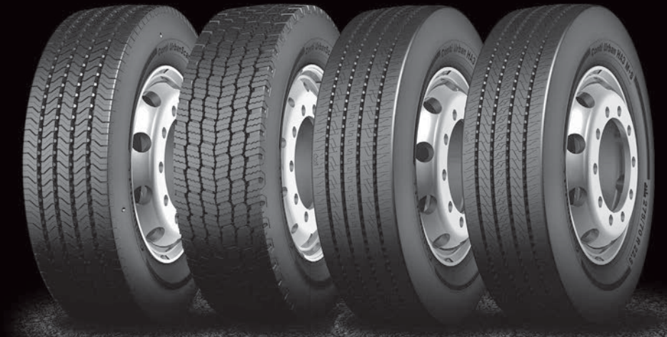
Conti Urban Scan HA3 Conti Urban Scan HD3 Conti Urban HA3 Conti Urban HA3 M+S