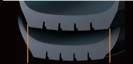
Örnek: Daha geniş sırt