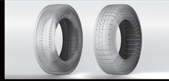
Örnek: Daha yüksek tel yoğunluğu