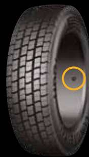
Sensore e contenitore installati