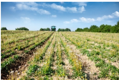
Continental_PP_Naturkautschuk aus Löwenzahn

Der Urban Taraxagum von Continental ist der erste in Serie gefertigte Fahrradreifen aus Löwenzahn-Kautschuk.