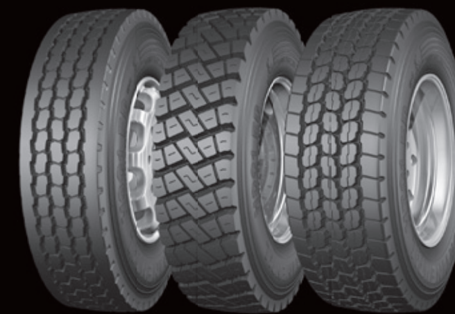
HSC 1 ED HDC 1 ED HTC 1 ED

Encaisser mieux les chocs, transporter plus longtemps, créer de la valeur. Truck Tires Construction