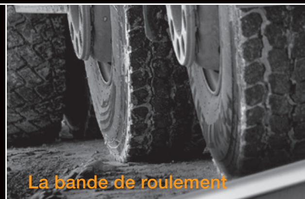
La bande de roulement

La ceinture à quatre plis, dont la seconde et la troisième nappe sont renforcées