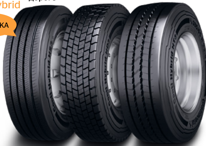
Conti Hybrid HS3+ Conti Hybrid HD3 Conti Hybrid HT3 3