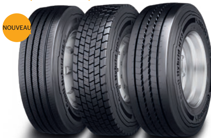
Conti Hybrid HS3+ Conti Hybrid HD3 Conti Hybrid HT3 3