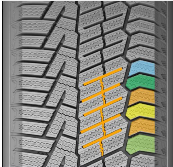
千鳥トレッド・パターン