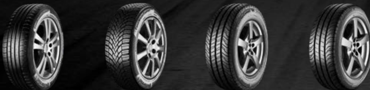
ContiPremium Contact 5