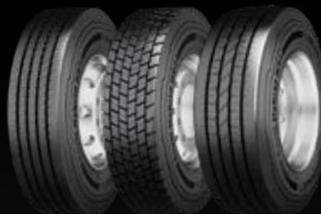
Conti Hybrid HS3 (1) disponible en 19.5" y 22.5" Conti Hybrid HD3 (2) disponible en 19.5" y 22.5" Conti Hybrid HT3 (3) disponible en 19.5" y 22.5"