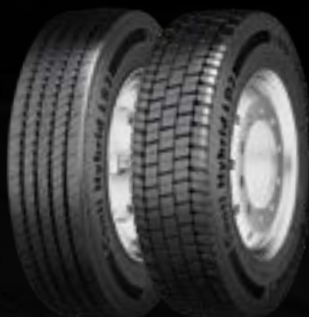
Conti Hybrid LS3 (1) Conti Hybrid LD3 (2)