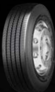
Conti Urban HA3 M+S (1)