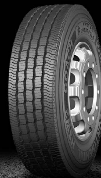
HSW 2 COACH