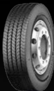
Conti UrbanScandinavia HA3 (1)