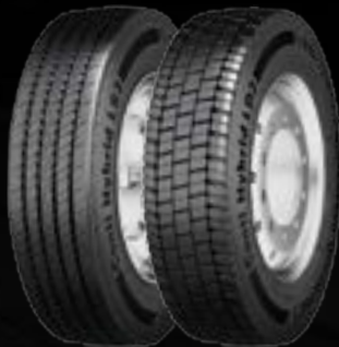
Conti Hybrid LS3 (1) Conti Hybrid LD3 (2)