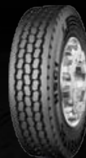
HSC1 (1) para montar en todos los ejes