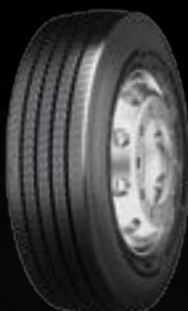
Conti Urban HA3 M+S (1)