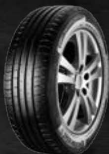
ContiPremium Contact 5