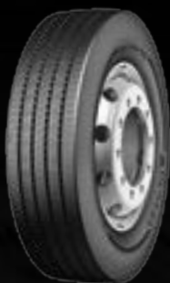
Conti Urban HA3 (1)