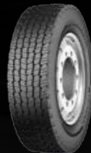
Conti UrbanScandinavia HD3 (2)