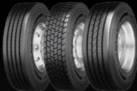
Conti Hybrid HS3 (1) disponible en 19.5" y 22.5" Conti Hybrid HD3 (2) disponible en 19.5" y 22.5" Conti Hybrid HT3 (3) disponible en 19.5" y 22.5"