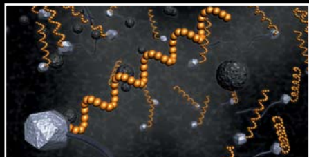
Ejemplo: compuesto especial para mojado