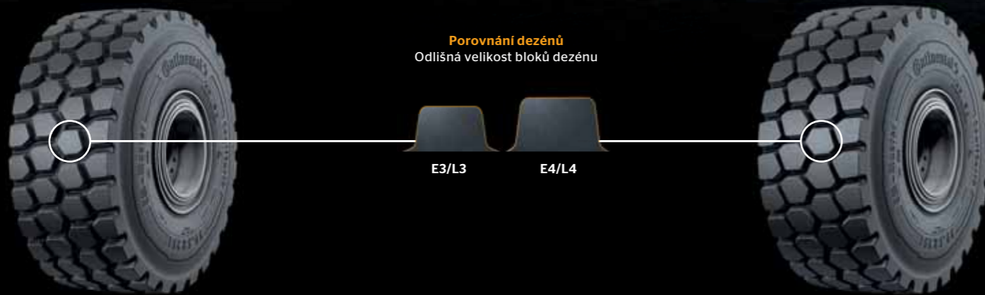
Porovnání dezénů Odlišná velikost bloků dezénu